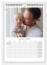
WANDTERMINKALENDER A4, HOCHFORMAT

Die Bestellzettel können direkt am 13.7. ausgefüllt werden oder per Mail an info@gemeinde-levenhagen geschickt oder in den Briefkasten von Fam. Lafsa, Dorfstraße 12a geworfen werden.