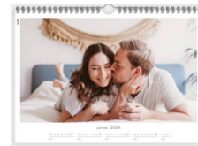
FOTOKALENDER, A4 QUERFORMAT